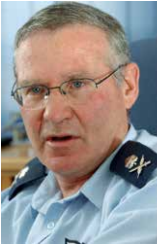
אלוף עמוס ידלין - ראמ"ן ערב המלחמה בלבנון ובמהלכה

אמ"ן כ"מעריך הלאומי" שתפקידו להגדיר את סוגי האויב שמולם מתמודדת מדינת ישראל וכאחראי על יצירת תובנות מודיעיניות, כבסיס לפיתוח ידע ותובנות אסטרטגיות ומערכתיות.