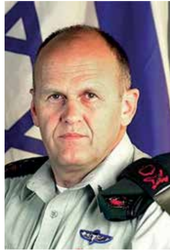
אלוף אהרון זאבי (פרקש) - ראמ"ן עד ינואר 2006