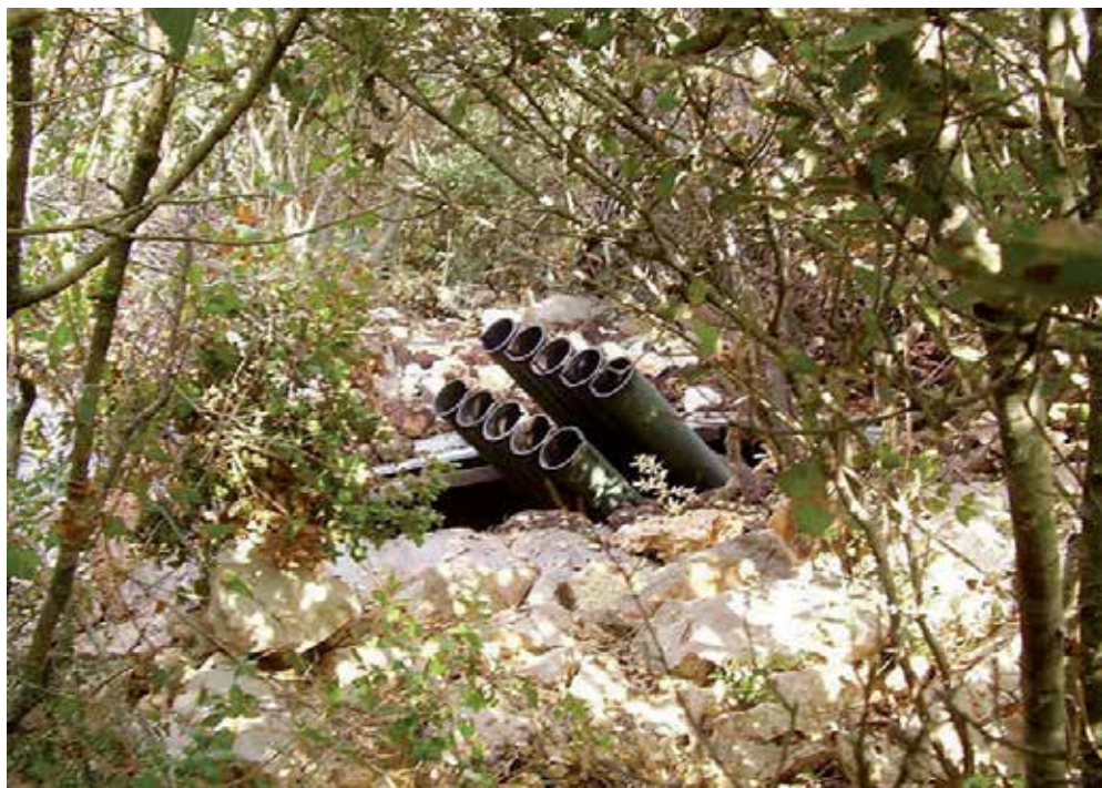
"שמורת טבע": היערכות מוסווית של חזבאללה בשטחים בלבנון