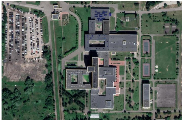
FSB Center of Operations, located at Trubetskaya Street 116 in the Moscow suburb of Balashikha