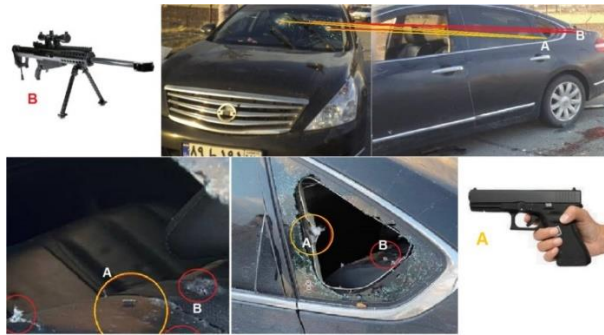
שיחזור זוויות הירי בפח'ריזאדה על פי תחקיר אינטליטימס