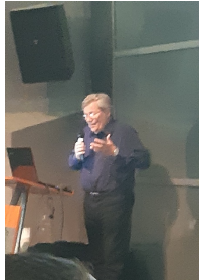
פרופ' שמעון שמיר