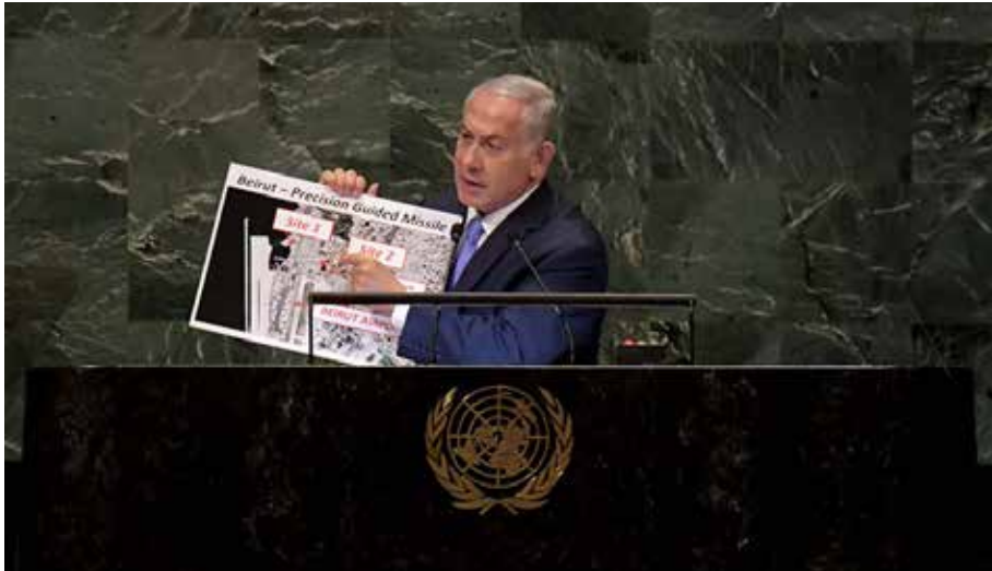
ראש הממשלה בנאומו בעצרת האו"ם, 27 בספטמבר 2018.

ביטחוניים ברמה הלאומית. מסקנה אפשרית וחשובה מהאירוע היא שמאמץ הסברתי-מודיעיני משולב יכול להביא להישגים משמעותיים בזירה המדינית ולשרת את האינטרסים הלאומיים החיוניים ביותר.