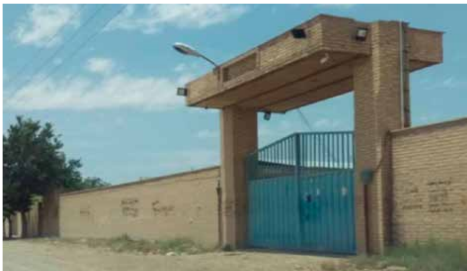
מחסן הגרעין של איראן, טורקובאד, טהראן.

ופרסם סרטון קצר והומוריסטי שנועד להגחך את המהלך, בו הציג מה ניתן לעשות בשלושה ימים, כולל פינוי טילים מהאתרים.